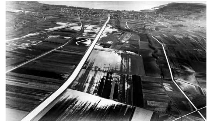
La deuxième correction des eaux du Jura a limité les inondations

MOULIN MOULINE, 6 ème festival au fil de l'Orbe, du 30 août au 8 septembre 2019