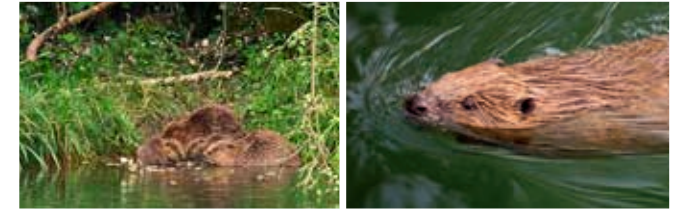
Les castors de l'Orbe sont visibles dans un film (projeté sur demande)

La plaine de l'Orbe, ses étangs et sa mise en culture sont très présents dans les expositions et les films. En 2018, un projet de Troisième correction des eaux du Jura est lancé, du Mormont à Soleure. Il s'agit de lutter contre les changements climatiques qui, si rien n'est fait, pourraient limiter gravement la production agricole du Plateau suisse.