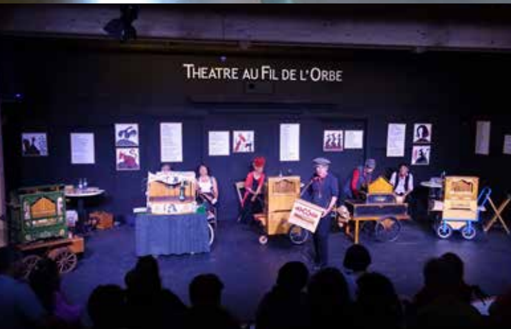
Les Tourneurs de manivelle au théâtre