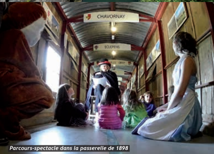
Parcours-spectacle dans la passerelle de 1898